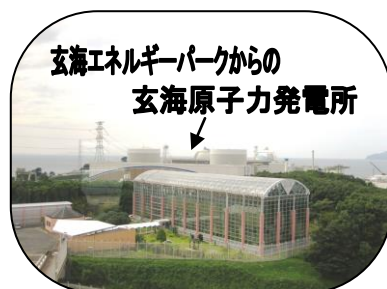
玄海エネルギーパークからの 玄海原子力発電所