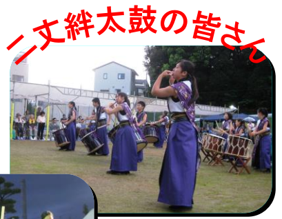
二丈絆太鼓の皆さん